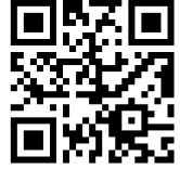
Foto direkt bearbeiten

Die Funktion ein Foto direkt zu bearbeiten dürfte den meisten bekannt sein. iPadOS bietet eine sehr umfangreiche und komfortable Möglichkeit die eigenen Fotos zuzuschneiden, optisch zu verändern oder mit Annotationen zu versehen.